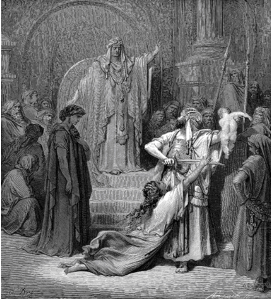
Gustave Doré, Sąd Salomona